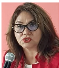
Nuria Gonzales – Magistrada del T.S.J

Sin embargo, no es momento de abrir la posibilidad ni siquiera de reformas formales, pues, con el actual régimen político autoritario, sería exponerse a distorsiones, abusos e incompatibilidades con la potencialidad democrática que ella contiene”.